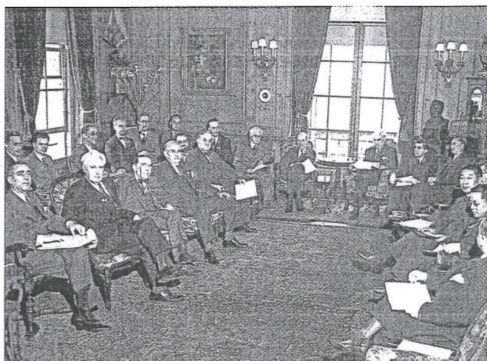
Frankrike, Kina, Sovjetunionen, Storbritannien och USA fick namnet "Big 5" i samband med bildandet av FN. Här möts de fem delegationerna under San Franciscokonferensen 1945.

När det gäller säkerhetsrådets kompetens kan konstateras att rådet under de senaste åren har brutit ny mark inom FN-stadgans ramar. Ett av de mera uppse-